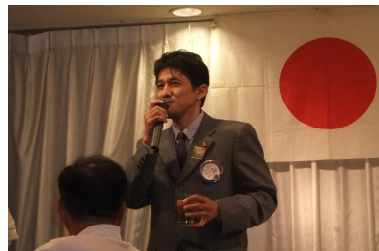
高知北LC岩井会長様