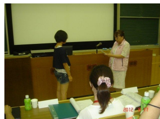
キャンパーへライオンズクラブより贈呈