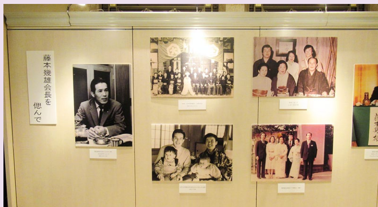
思い出の写真のパネル展示。