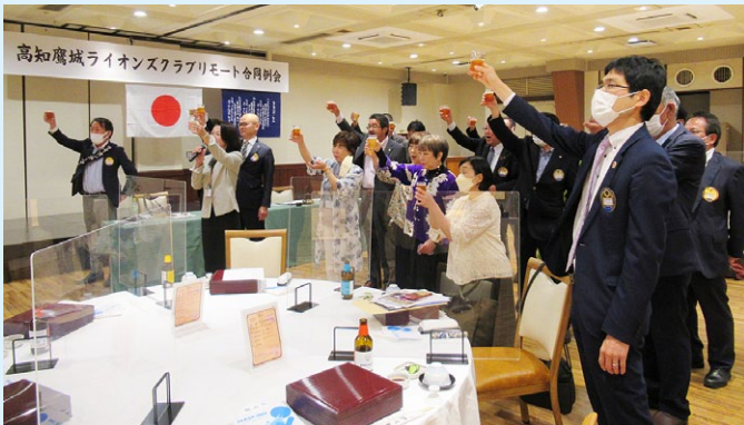
高知地ビール「TOSACO」にて乾杯!