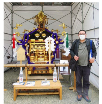
北海道神宮頓宮にて