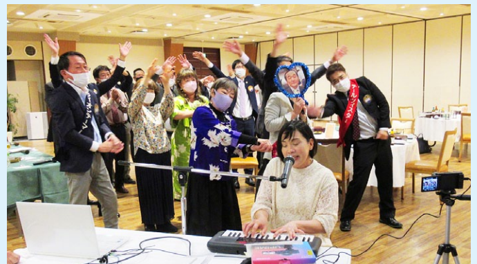
高知から札幌へのラブコール、「君はともだち」を熱唱。