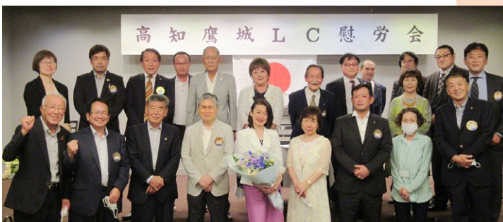
西森会長、1年間お疲れ様でした。