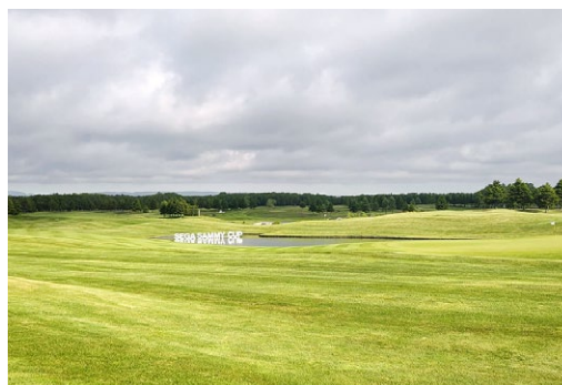
ザ・ノースカントリーゴルフクラブ