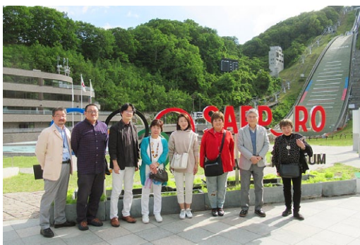
札幌オリンピックミュージアムにて