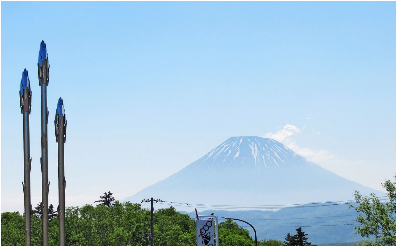
道の駅 望羊中山から望む羊蹄山

Kochi Yoojyo Lions Club ライオンズクラブ国際協会 336-A 地区 7R-1Z