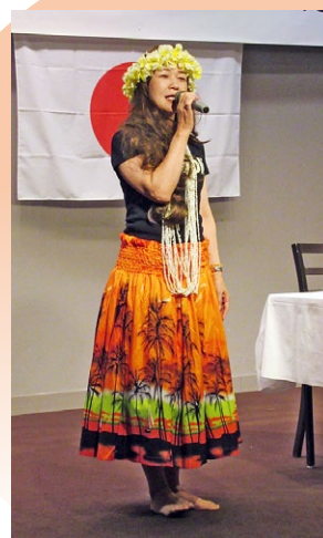
余興は、今期結成したシャードウファルコンのラストコンサート。