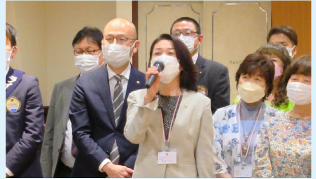
会長の挨拶に始まり、互いの近況を報告しました。