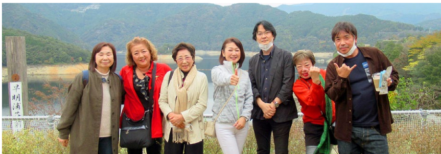
豊永郷歴史民俗資料館見学日帰りバスツアー