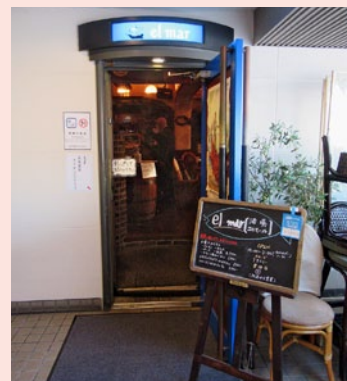
今回、例会をさせていただいた『酒場 エルマール』。おいしいお酒をいただきました。