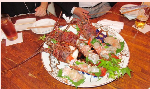
一人に二尾ずつ…贅沢です。