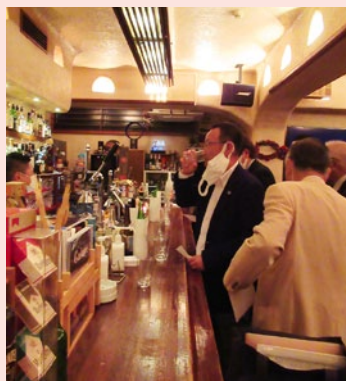
余興の利き酒大会。土佐鶴、司牡丹、南、亀泉の全てを当てた方はいませんでした。