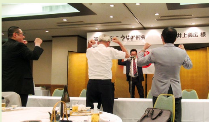
上森GMT・GLT・FWT・会則委員によるローア