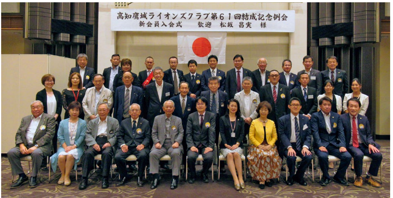
〈写真上〉8月2日(日) ガバナー公式訪問 〈写真下〉10月1日(木) 第61回結成記念例会