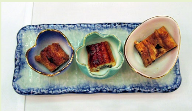
中国産・国産養殖・国産天然のうなぎを使って、格付けチェック。