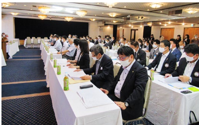
7R筆頭の高知鷹城LCはいつも一番前の席です。

一地区ガバナーのお膝元である7Rのガバナー公式訪問は終始和気藹々とした雰囲気で行われました。