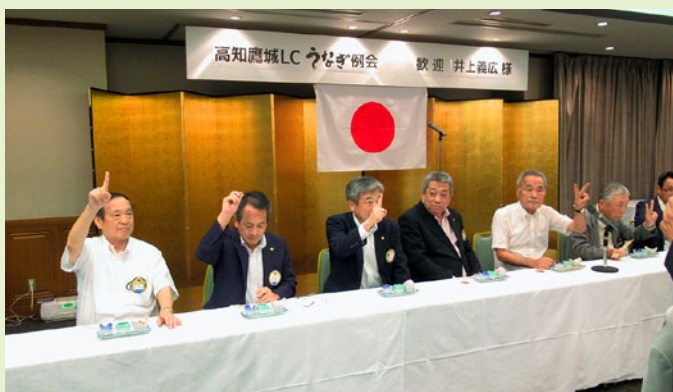
意外にも全問正解者は一人だけでした。