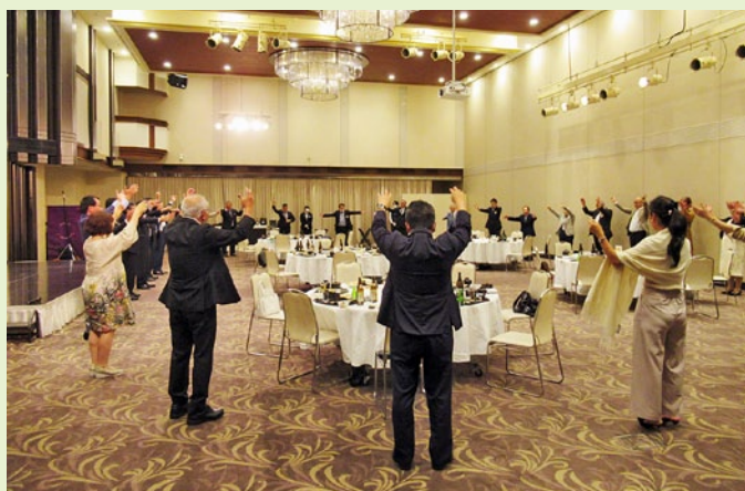
「万歳三唱」ではありません。 コロナ感染防止のため、手をつなぐに「また会う日まで」