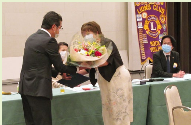
L布の入会式も同時に行われました。