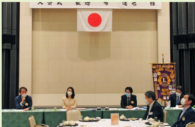
寂しいですが、ソーシャルディスタンスで。