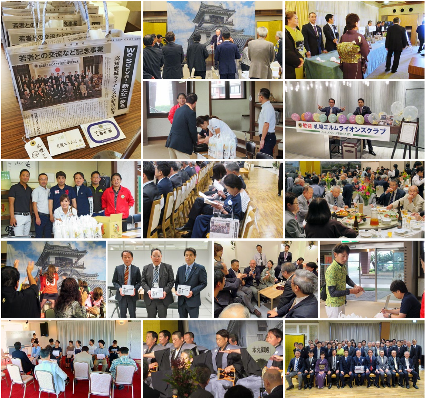
結成60周年を振り返って

Kochi Yoojyo Lions Club ライオンズクラブ国際協会 336-A 地区 7R-1Z