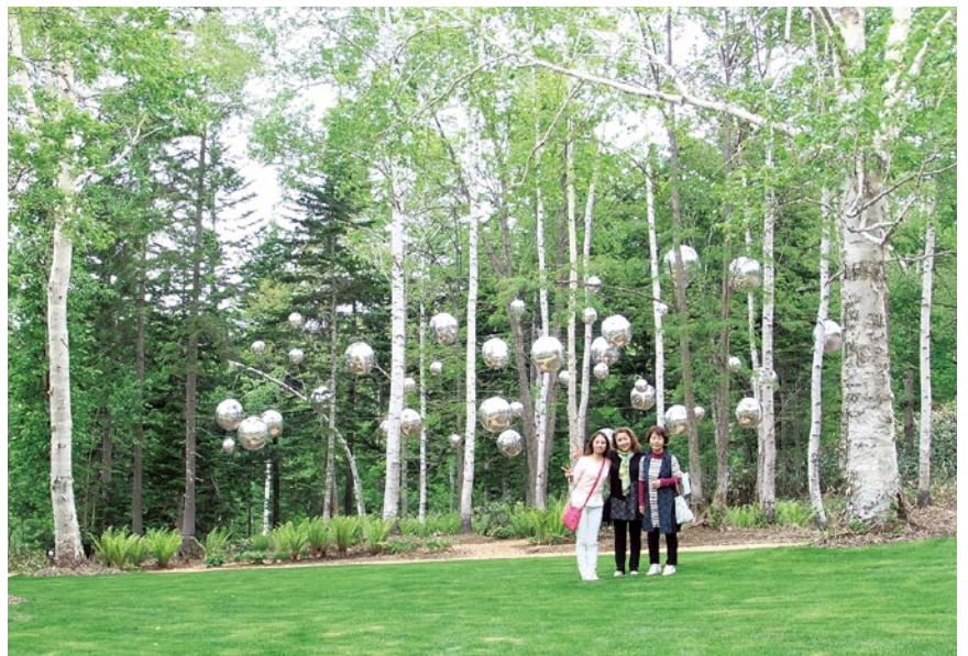
6月7日~10日 札幌エルムLC訪問