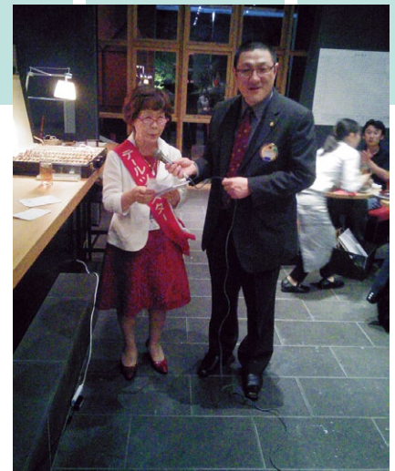
L中岡も緊張の初テールツイスタータイム。

この日も、ビジターとして例会に出席していただき、作品作りについての説明や、ろくろ選手権等のパフォーマンスもしていただきました。今後の例会を楽しみにしててください。