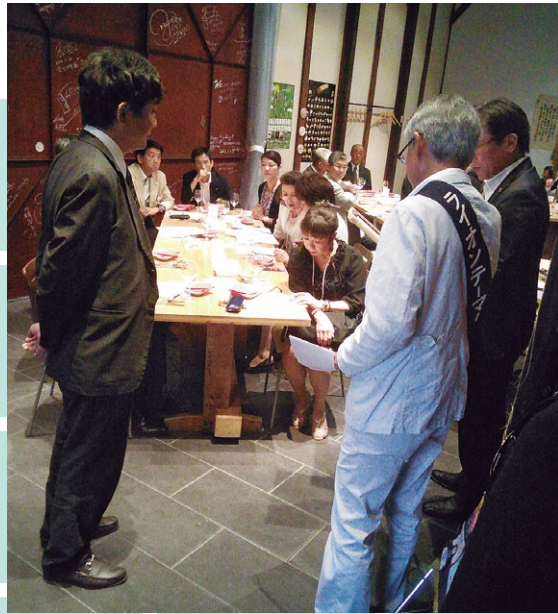
新会長より前三役へ記念品の贈呈。