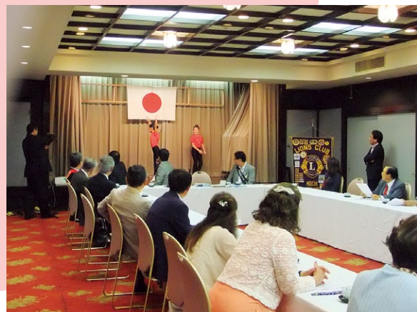
舞台上で少し演技を披露。

結成55周年記念事業『実現させたい夢』に応募してくれた、ティアラ土佐の小学生2名が最終選考に向けて、「フェアリージャパンの方に演技指導してもらいたい」という夢をPRをしてくれました。