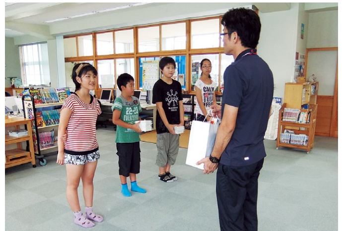
【写真上】7月6日 浦戸湾・七河川一斉清掃、【写真左下】7月8日 国際平和ポスターツ橋小学校訪問、【写真右下】7月14日 ありがとうメッセージ葉書贈呈式