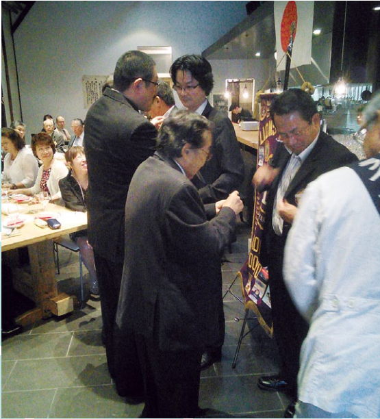
前三役から新三役へラベルボタンの交換です。