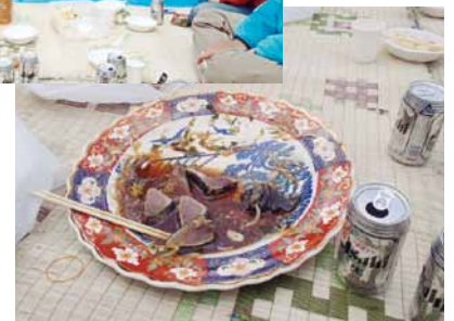
たたきは瞬く間に無くなった