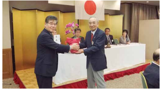
次期キャビネット幹事L濱田へ 会長より激励