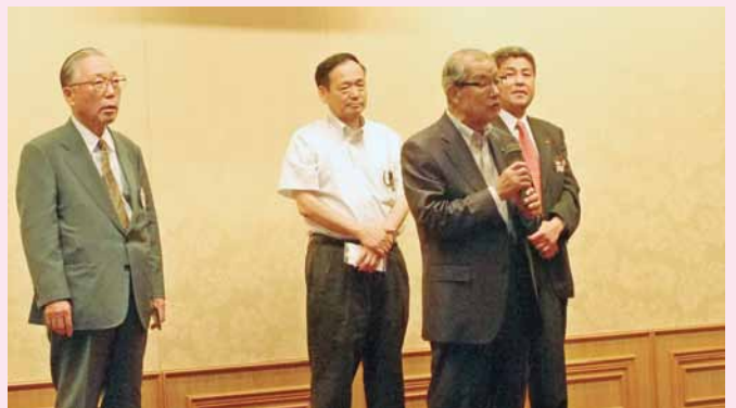
左から次期7R-1ZC菅 次期IT特別委員長弘内 7R-1ZC西森 次期キャビネット副幹事坂本