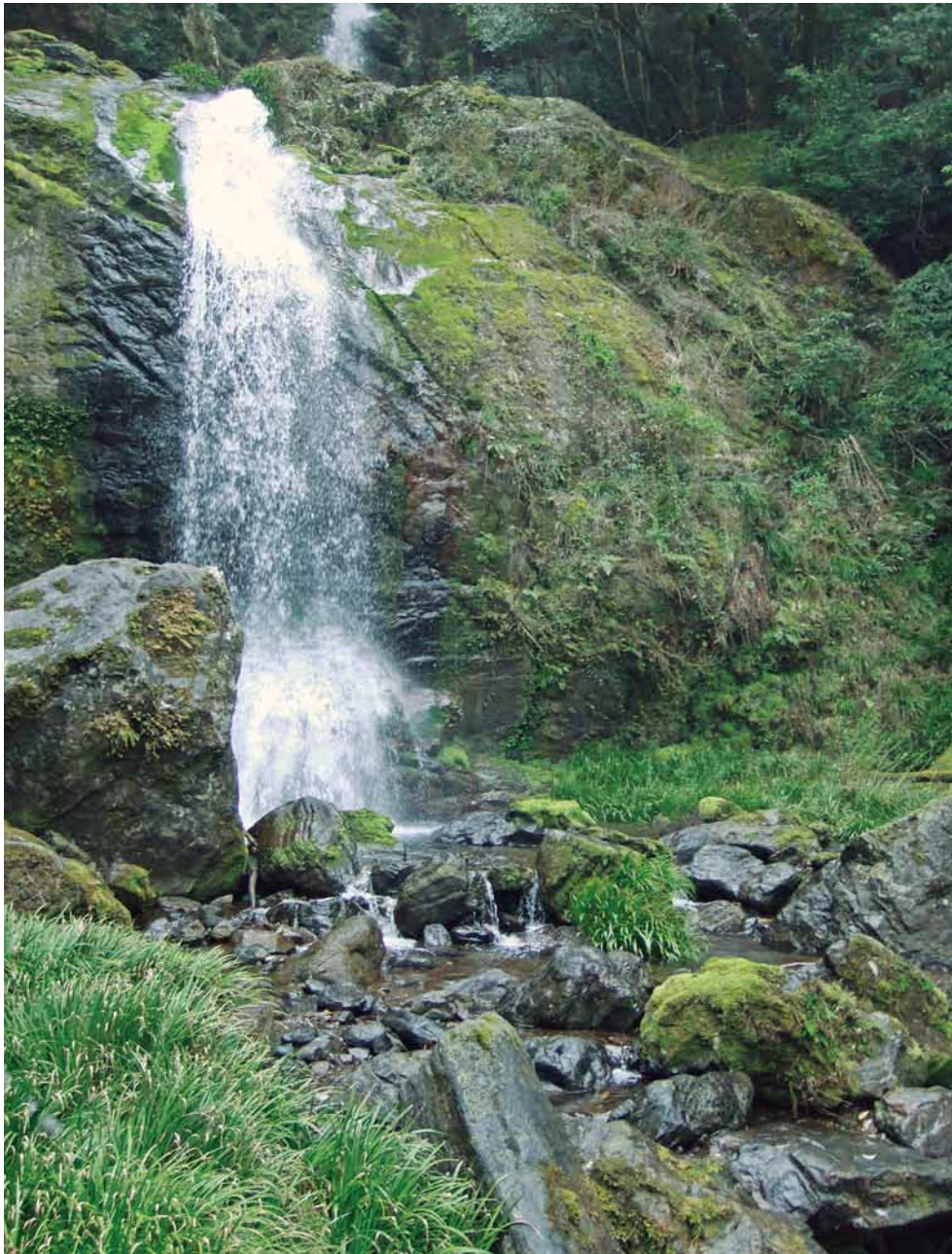
高知市鏡 平家の滝

Kochi Yoojyo Lions Club ライオンズクラブ国際協会 336-A 地区 7R-1Z