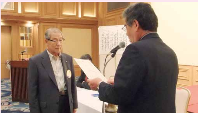
7R-1ZC西森へ会長より感謝状