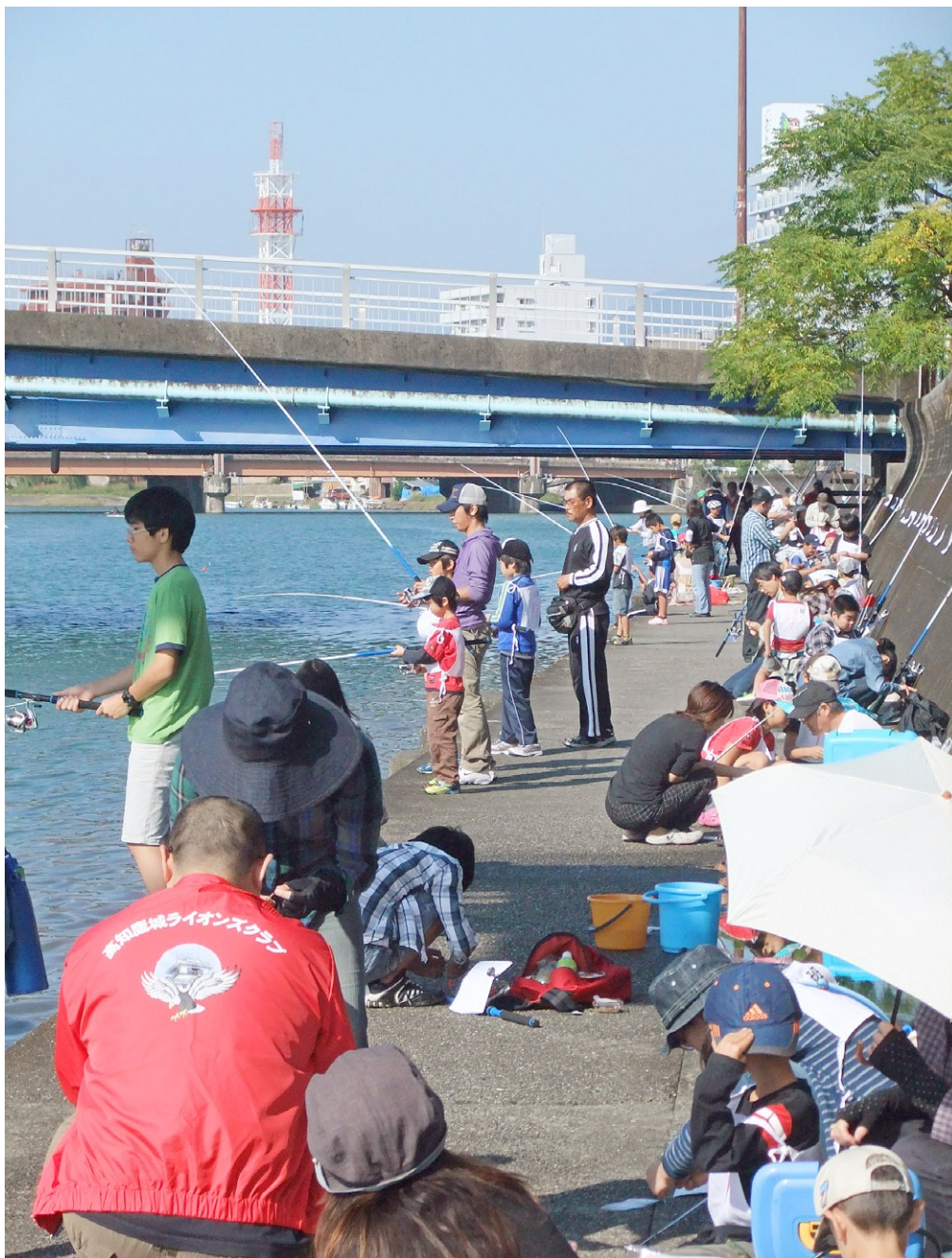
2011年10月16日 ちびっ子ハゼ釣り大会

Kochi Yoojyo Lions Club ライオンズクラブ国際協会 336-A 地区 7R-1Z