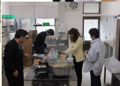
今年の山菜例会は春の訪れを待た ずに行ったので、山菜は少なかった のですが、きれいな自然を満喫 して来ました。会員さんの作った しし鍋が最高にうまかった！！