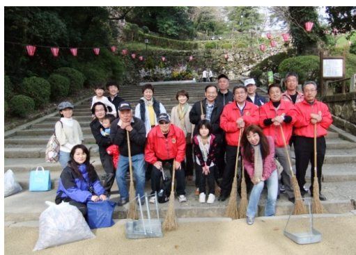
高知城集合で追手門周辺清掃を 行いバスで移動しました。