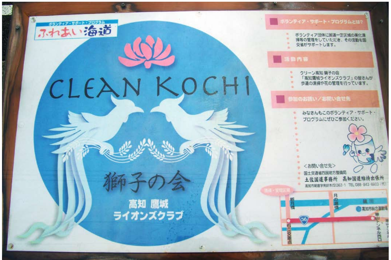
土佐道路にある表示板

この事業を実現させた当時の会長・幹事の28名の同志は、グループ名を“クリーン高知獅子の会”と命名。そして、平成16年6月6日に第1回LC合同国道一斉清掃がスタートしたのです。