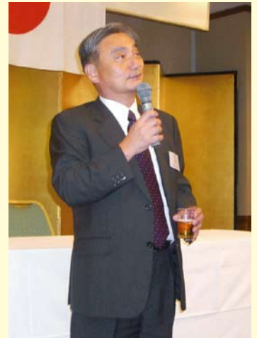
乾杯 高知LC L伊野部