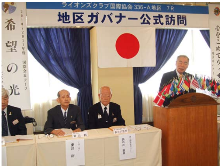
ご挨拶される宇高地区ガバナー

ました。その後全体会・懇親会がありました。7月に不安と期待の中、現体制がスタートし、約3ヶ月過ぎ少しずつ落ち着きつつある中、各クラブの話、時には悩み事のような話も聞かせて頂き、地区ガバナーはじめ役員、委員の方からアドバイスを頂き、色々と参考になったのではないかと思います。各クラブによって考え方、アクティビティの違いは若干あると思いますが最終的には行きつく先は同じではないかと考えます。私のスローガン「ライオンズクラブを通じて社会に貢献する」私達の活動を通じて世の中の為になる事を本来の形だと考えます。地区ガバナー方針「明るく、やさしく、心をこめてWe Serve」後9ヶ月楽しくやりたいと考えております。