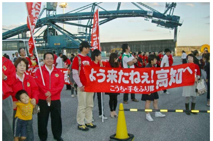
50周年記念事業継続「こうち・手をふり隊」第2弾 2010.9.25 (土) 高知新港