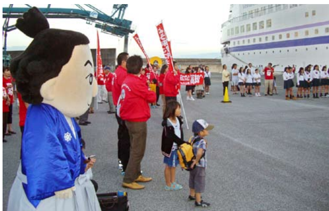
りようま君の着ぐるみも参上