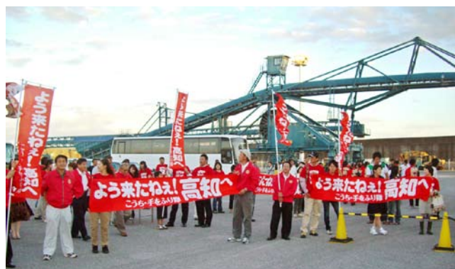
出航準備中のため、客船からはなれて待機