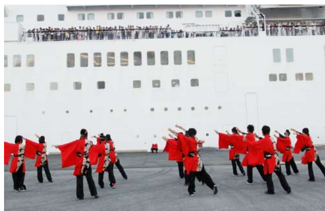
伊野商業高校のよさこい踊り。衣装が手をふり隊と同じ赤色