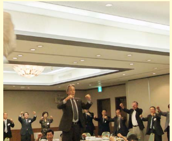
ライオンズローア 高瀬7R-3ZC