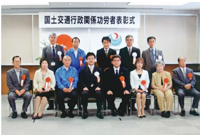
国道清掃活動に対して表彰を受けました。