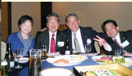
この笑顔を忘れない