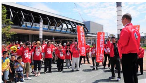
発足式での会長あいさつ

私達のこのアクティビティー「こうち・手をふり隊」が子供さんからお年寄りまですべての年代の方が高知県全県下で「おもてなし運動」として定着していくキッカケになればと思っています。