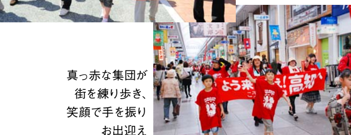
真っ赤な集団が街を練り歩き、笑顔で手を振りお出迎え