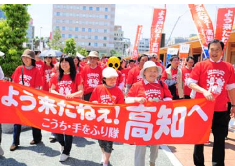
いよいよ高知駅前からパレードがスタート