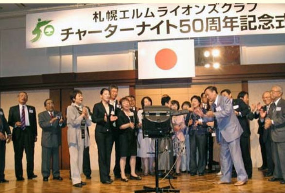
おいらの船は300トンを大合唱