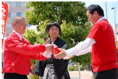
高知県などへ横断幕を贈呈