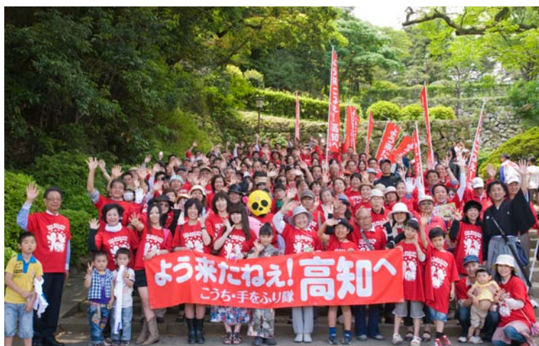
高知城追手門で「よう来たねえ! 高知へ」大集合!