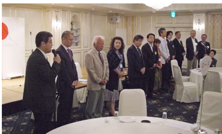
新役員・理事紹介