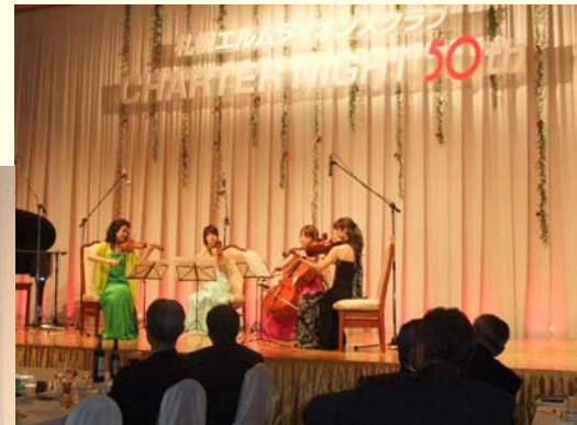
CN50周年記念コンサート