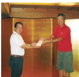
7月27日(日) ゴルフ取り切り戦