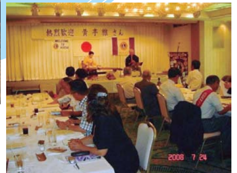
矢野Lも尺八演奏でお出迎え