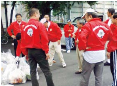
7月6日(日) 市内LC合同国道一斉清掃